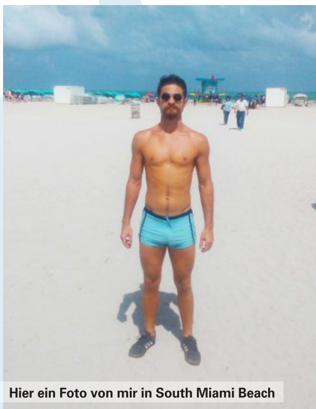
Hier ein Foto von mir in South Miami Beach

Nun, in South Miami Beach ist dies tatsächlich eine durchaus akzeptable Bekleidung. Es gibt eine Menge Europäer hier die oft sehr knappe Badehosen tragen, aber gemäß den amerikanischen Standards ist dies eine sehr dürrtige Badehose. Ich finde dass die meisten Amerikaner außerhalb von Miami Beach tatsächlich denken, dass ich absichtlich versuche mich lächerlich und komisch zu machen wenn