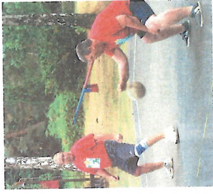
Prellball ist eine von vielen Sportarten, die der FSB anbietet.

Giffhorn ist besonders stolz auf die gute Jugendarbeit. Ende 2017